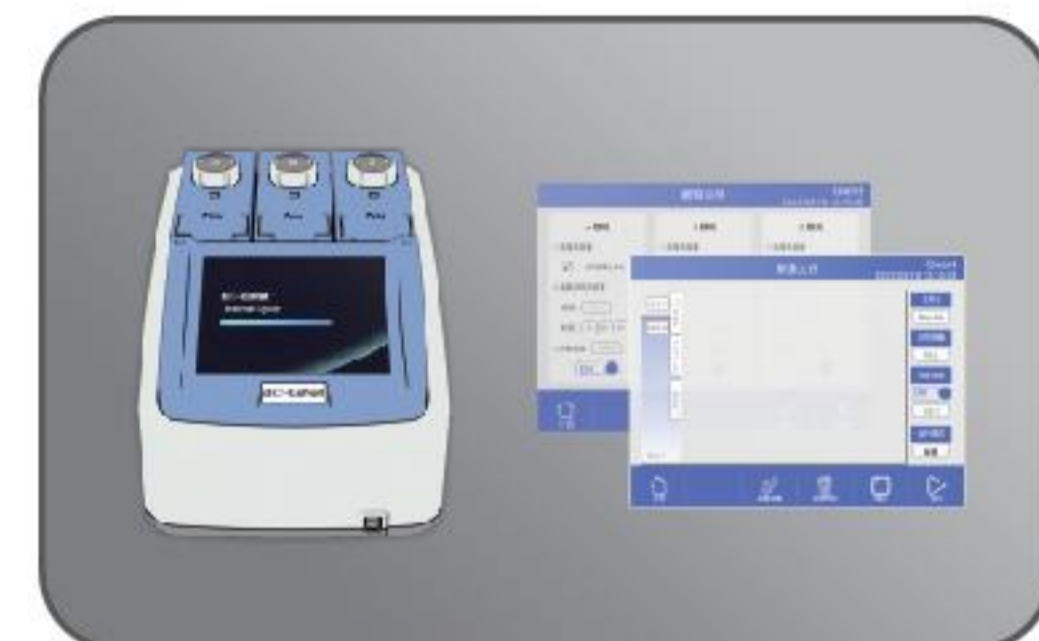
实时显示程序进展剩余时间,支持PCR仪运行中间编程;