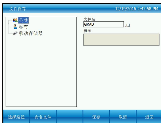
图七：命名文件和选择文件保存路径

在编辑文件界面（图六）下，所有内容输入完毕后，按“完成”按钮，进入文件保存界面（图七），在文件保存界面下，先按“选择路径”按钮，选择保存路径，再按“命名文件”按钮，命名文件，文件名输入完成后“保存”按钮保存新建的文件，并退回到文件库界面。编辑的文件在文件保存界面下若没有重命名文件，则覆盖原文件，若重命名文件，则新产生一个文件，原来的文件保留不变。