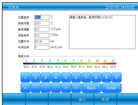
图五：选项内容编辑

输入梯度范围后，梯度分布显示每一列的梯度值，按“确认”按钮，返回到编辑文件界面（图六）。