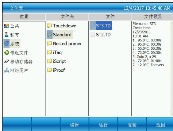
图二：焦点在系统文件上