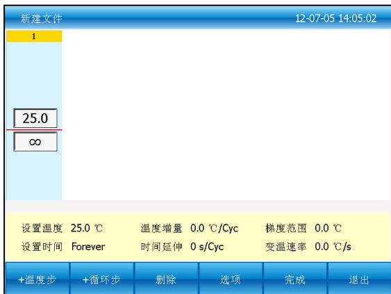
图三：创建一个新的文件

在图一界面下按“新建文件”按钮进入新建文件界面（图三），或在图二界面下按“编辑”按钮编辑现有的文件进入编辑文件界面（图四）。