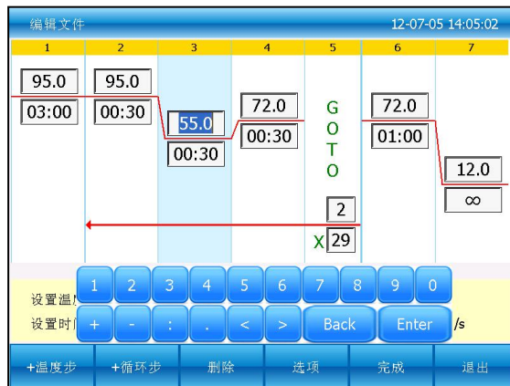
图四：编辑一个现有文件

在新建文件或编辑文件界面下按“+温度步”按钮，增加温度步骤。按“+循环步”按钮，增加循环步骤。