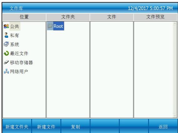
图一：焦点在公共根目录上